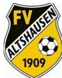
FV Sportfreunde Altshausen 1909 e.V.